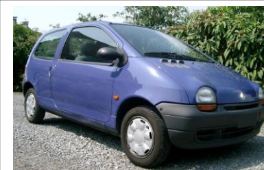
1993 : la Twingo