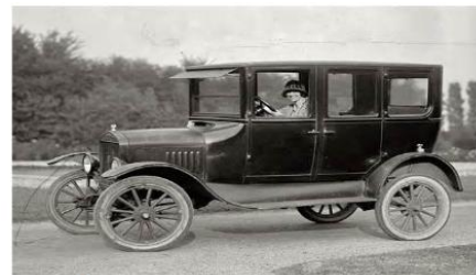
1903 : avec Ford premières voiture construites rapidement aux états Unis Il faudra attendre 1912 en France avec Renault et 1919 pour Citroën.