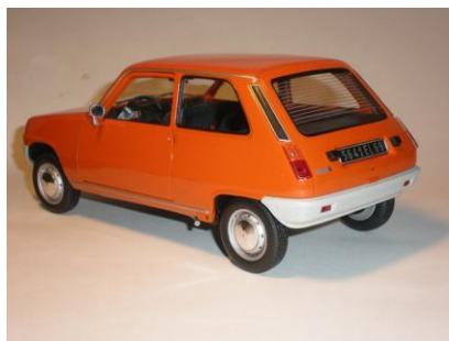
1972 : La Renault 5