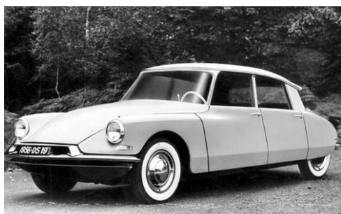
1955 : la DS