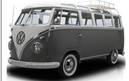
1950 : Combi Volkswagen