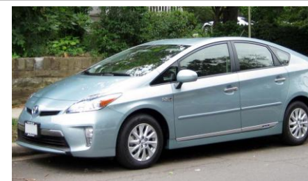
1997 : voitures hybrides