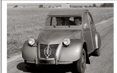
1949 : La 2CV