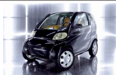
1993 : naissance des micro-voitures avec la Smart