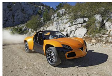
1996 : Voitures électriques modernes par souci de protection de l'environnement