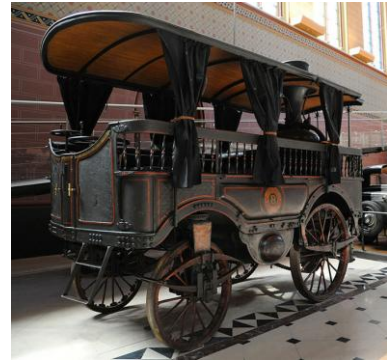
1873 : « L'Obéissante » voiture pour 12 personnes avec moteur à vapeur. Vitesse max : 40 km/h