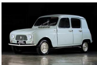
1961 : La 4L