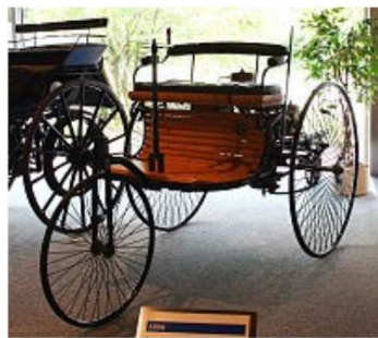
1886 : 1 ère automobile à 3 roues avec un moteur à explosion