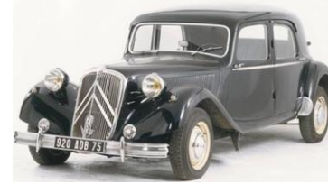
1934 : Traction avant