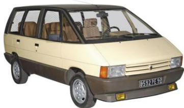
1984 : le monospace

1979 : Autorisation de circulation en France des voiture au gaz de Pétrole Liquéfié (GPL)