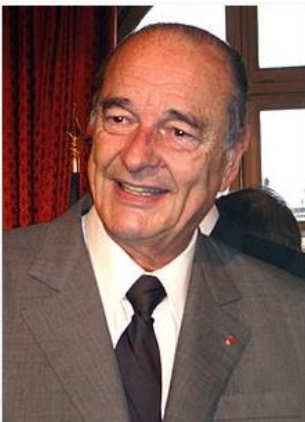
Jacques Chirac en 2006.

Retiré de la vie politique, il siège jusqu'en 2011 au Conseil constitutionnel, dont il est membre de droit en tant qu'ancien président de la République. Mis en cause dans de nombreuses affaires judiciaires pendant sa carrière, il a bénéficié de son immunité présidentielle, mais reste après son départ de l'Élysée poursuivi dans l'affaire des emplois fictifs de la mairie de Paris, dans le cadre de laquelle il est condamné à deux ans d'emprisonnement avec sursis en 2011, ce qui fait de lui le premier chef de l'État français à être condamné en justice. Malade, il effectue sa dernière apparition publique en 2014. Il décède le 26 septembre 2019 à l'âge de 86 ans.